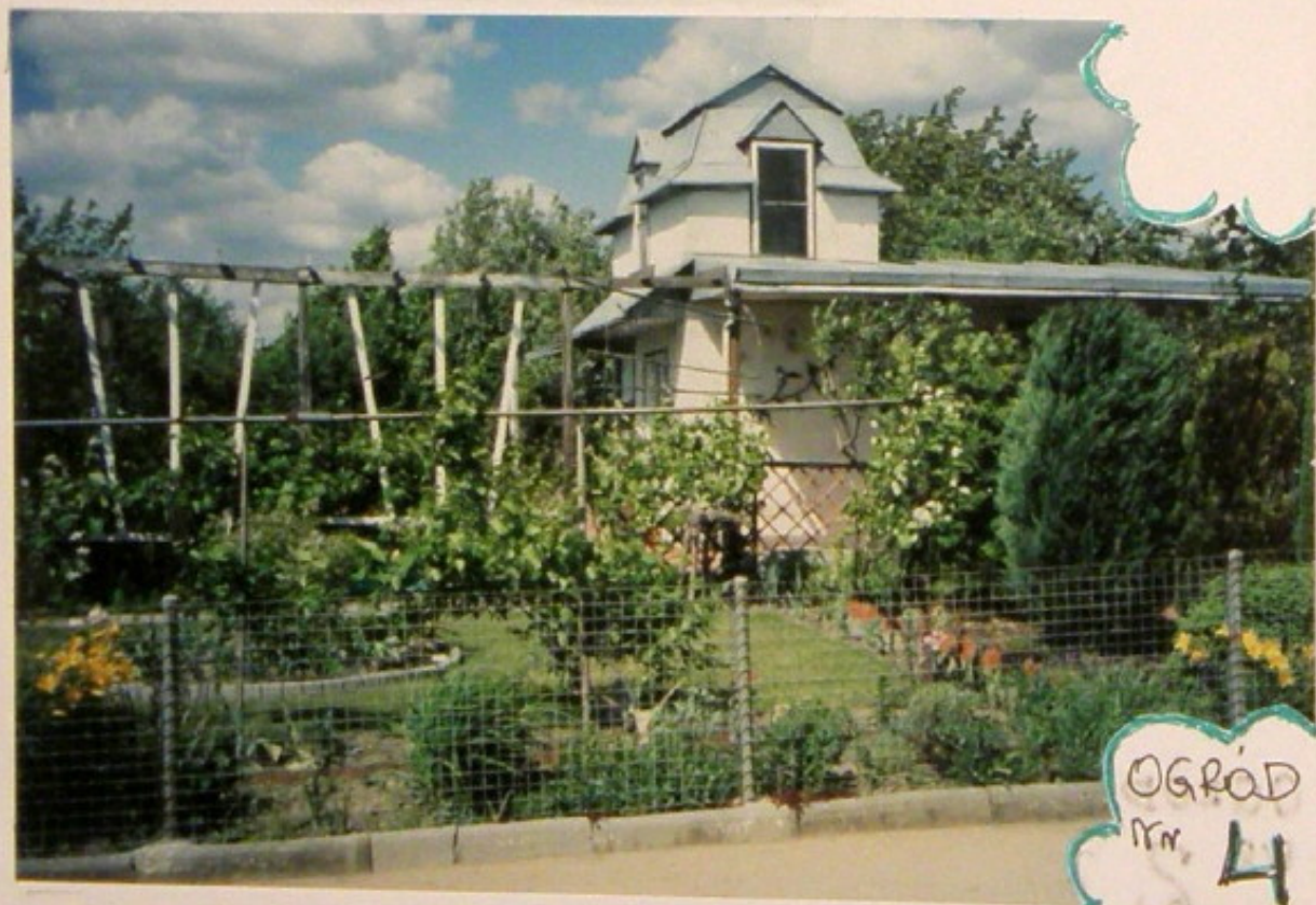
OGRÓD nr 4