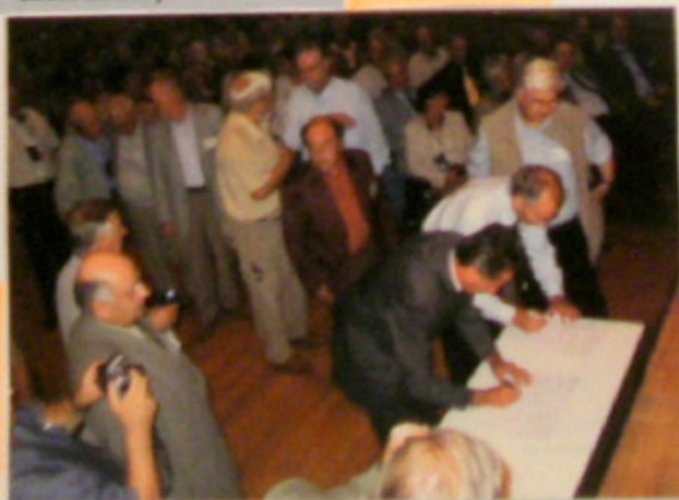
Uroczyste podpisanie Stanowiska Międzynarodowego Biura w sprawie obrony ruchu ogrodnictwa działkowego w Polsce