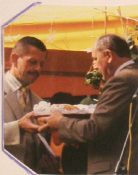
STAROSTA DOŻYNEK WRĘCZA BOCHEŃ CHLEBA Z TEGOROCZNYCH ZBIORÓW - BURMISTRZOWI