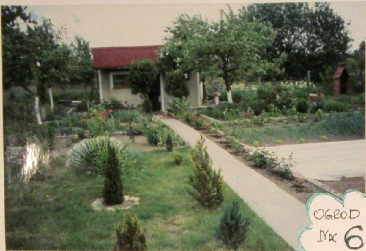
OGRÓD Nr 6