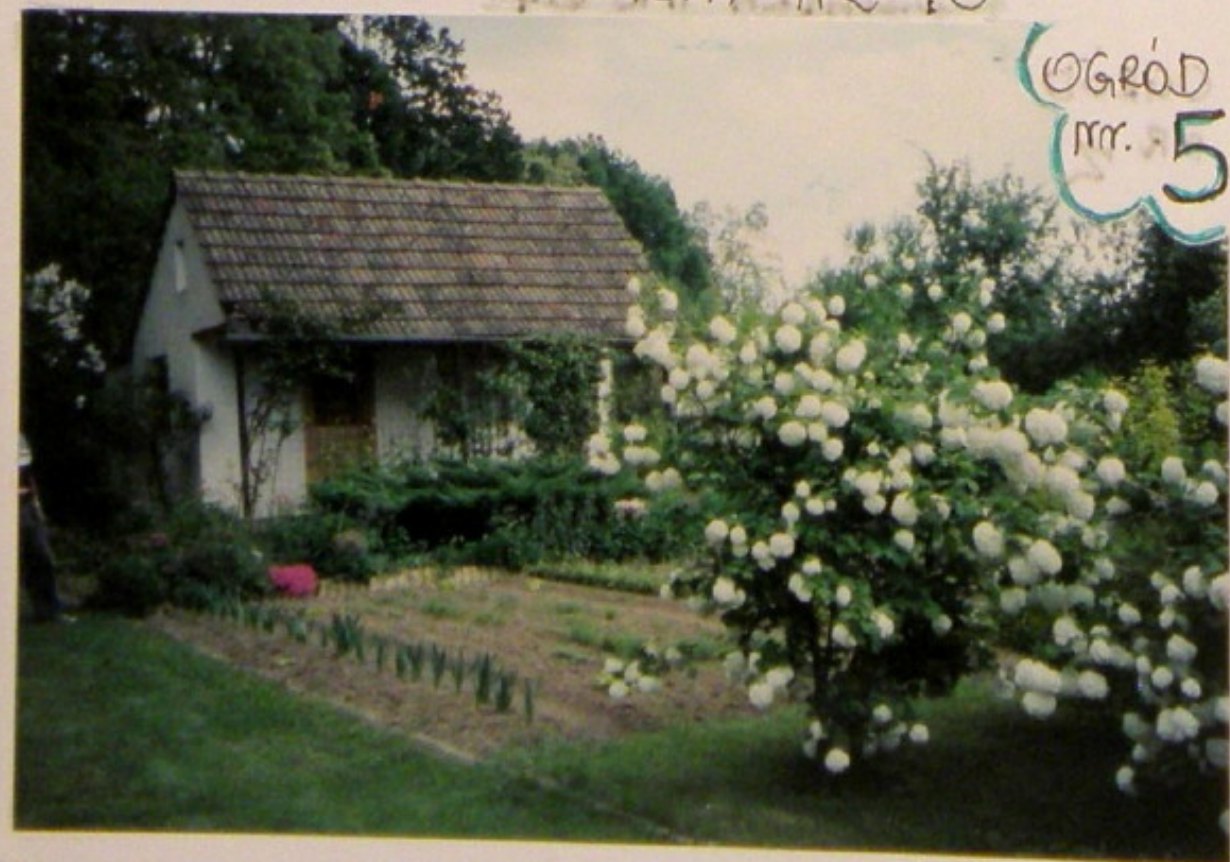
OGRÓD nr. 5