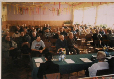
członkowie prezydium zebrania