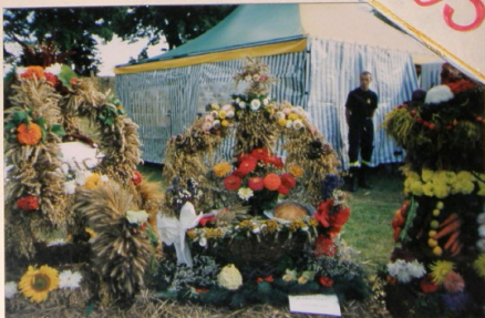
WYRÓŻNIONY „KOSZ” P.O.D.