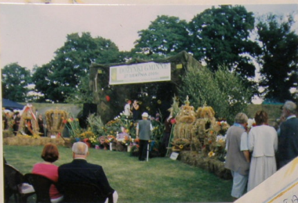
WYSTAWA WIENCÓW DOŻYWKOWYCH