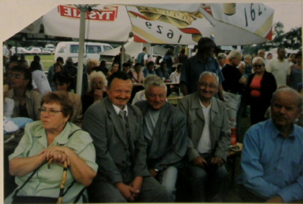
STARY RADUSZEC - DOŻYWKI GMINNE