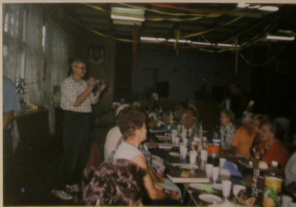
Zebrańce rozmawiają o wszystkim