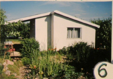
„LESNE OCZKO” 64