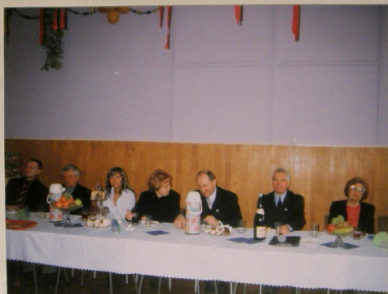
Organizatorzy i zaproszeni goście w zabawieniu ze spotkania.

Wszystkie panie otrzymały drobne upominki.