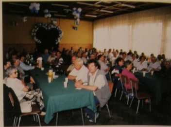
Gošue - dznalkov