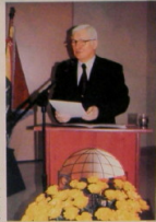
Przemisław Edward Szymański – Minister w Kancelarii Prezydenta RP

delegatów w obradach nie mogło uczestniczyć tylko 7 osób. Frekwencja wyniosła więc 97,2 procent. Pierwszy dzień obrad zakończyła rzeczowa dyskusja, w której głos zabralo kilkunastu mówców. Szczególnie gorąco delegaci reagowali na głosy, w których dyskutanckie podkreślali konieczność utrzymania jedności Związku. Nie zabrakło ostrych słów pod adresem przeciwników Związku.