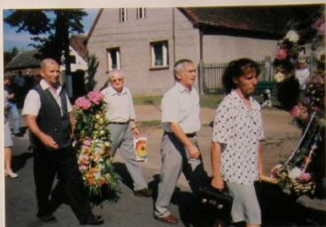
Delegacje z kosciami