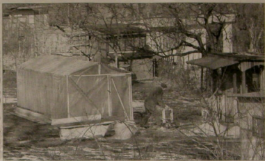
Wzrost za pasem, ale działkowcy nie wiedzą, czy ruszą na grządki. Jak twierdzi jeden z właścicieli ogrodników, opłaty rosną szybciej niż chwasty.

Działkowców czeka opłacenie podatku rolnego i od nieruchomości - domu działkownika. Twierdzą, że ich na to nie stać.