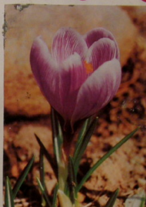
Bez krokusa wiosna nie jest wiosna.