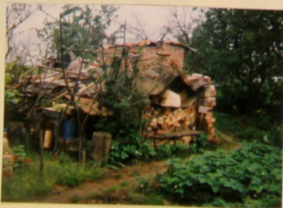
Niestety, są i takie przypadki, gdzie bieżąca na działce trwa już kilka lat, jak u p. Felca dz. nr 31.