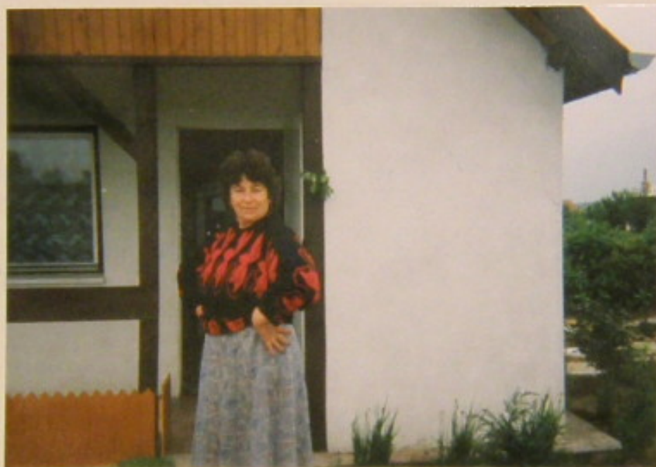
p. Olekna z dumą i radością spogląda na efekty swojej pracy na działce.