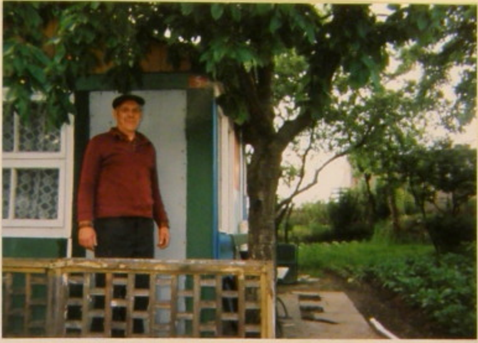
pan Procho wychodzi z altany do pracy na obłacie.