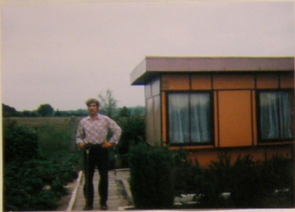
p. Dec na swojej bardzo ładnie zadbanej działce.