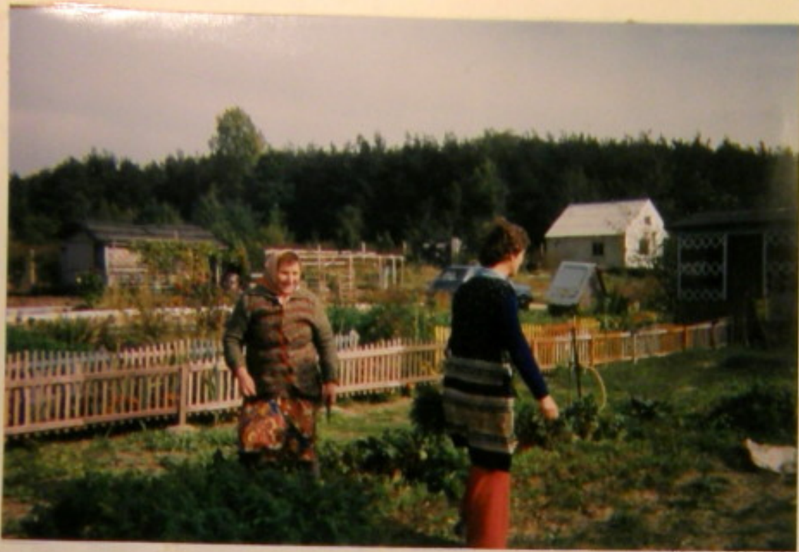
Działkownicy z ogrodu nr 6 przygotowują plony dla szpitala

Jak widać na zdjęciu na opel Langolu PoD włączyło się wiele ochotkowników z ogrodu nr 6.