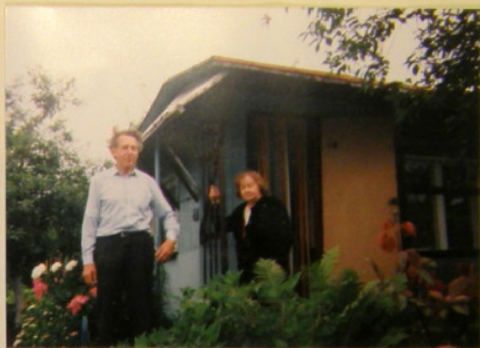
p.p. Piwnicy na swojej działce