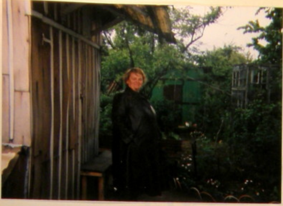
p. Piachlakowa z nabicią mogła na swoje rozkwitnięte kwiaty