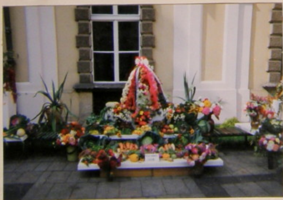
Nam podobat się bardzo tem niemiec i zdysce zmobiliśmy na wzór. Łejeł on u kategorii niemiec I miejsce.