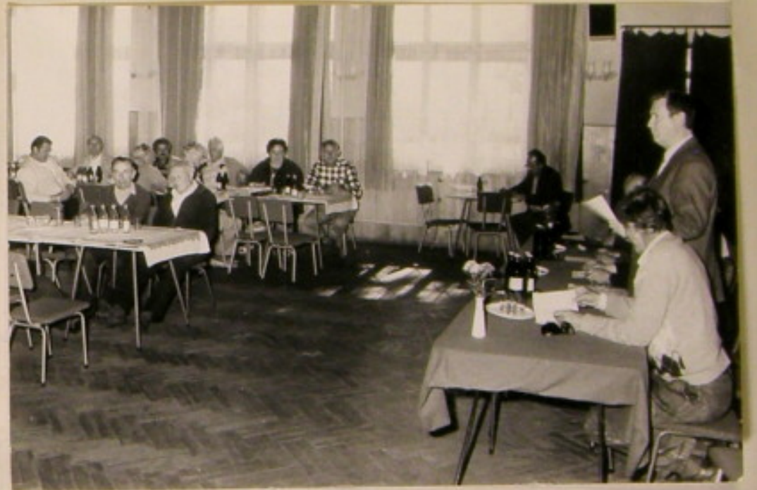
Prezes Janzole POD podaje pod ratnierekanie porządek obrad.