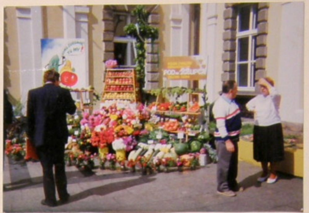
Stoisko ogrodnika "22 lipca" "Lielonej Górze".