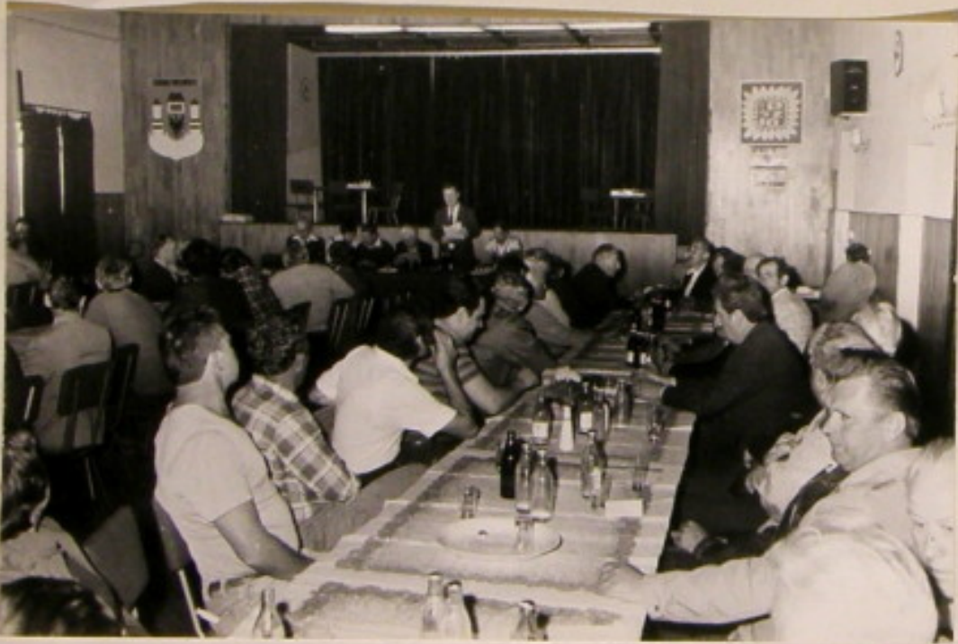
Nidok ogólny soli.

Wolne Zebranie Sprawozdania - Informacyjne oceniło pracę Janzole, stan zagospodarowania działek na 6-ciu ogrodach, przedstawiło sprawozdanie finansowe i bilans za okres od poprzedniego zebrania.