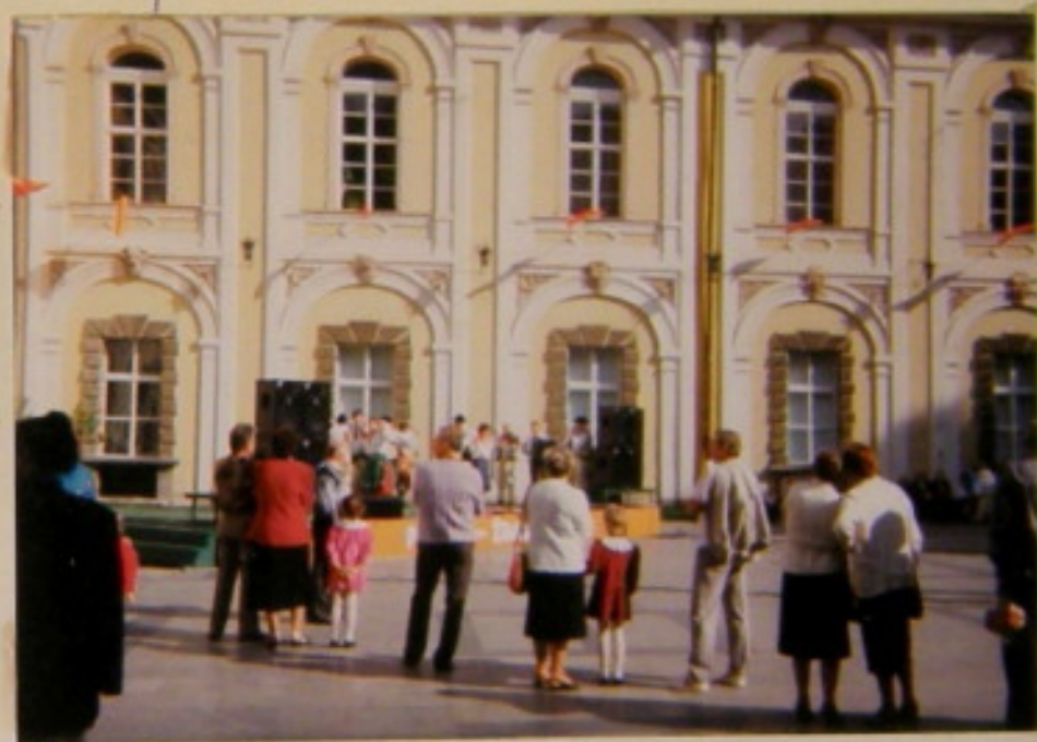
Chwilę pobytu umiata gónalski zespóli ludowy. Było co postuchać i zokazyć.