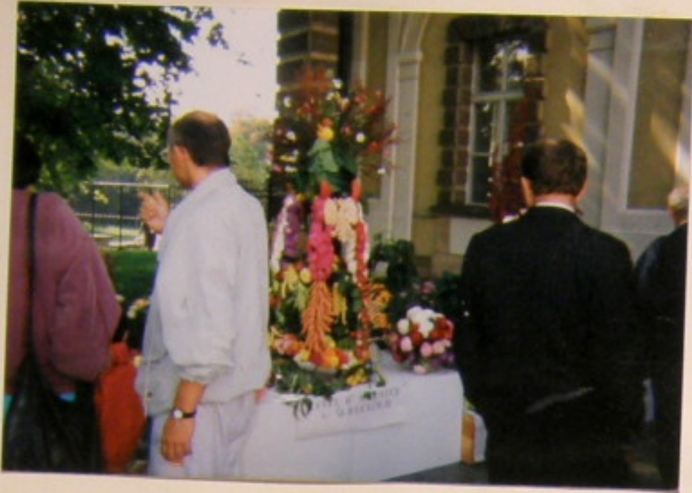
Stoisko jednego z ogrodników dzielnicy "Świebodzinie".