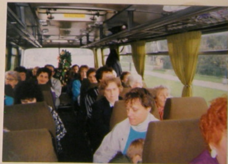
Do domu wracaliśmy zmagreni, ale kszepłini, bo nagrę pracę dostreżono i nagrodzono.