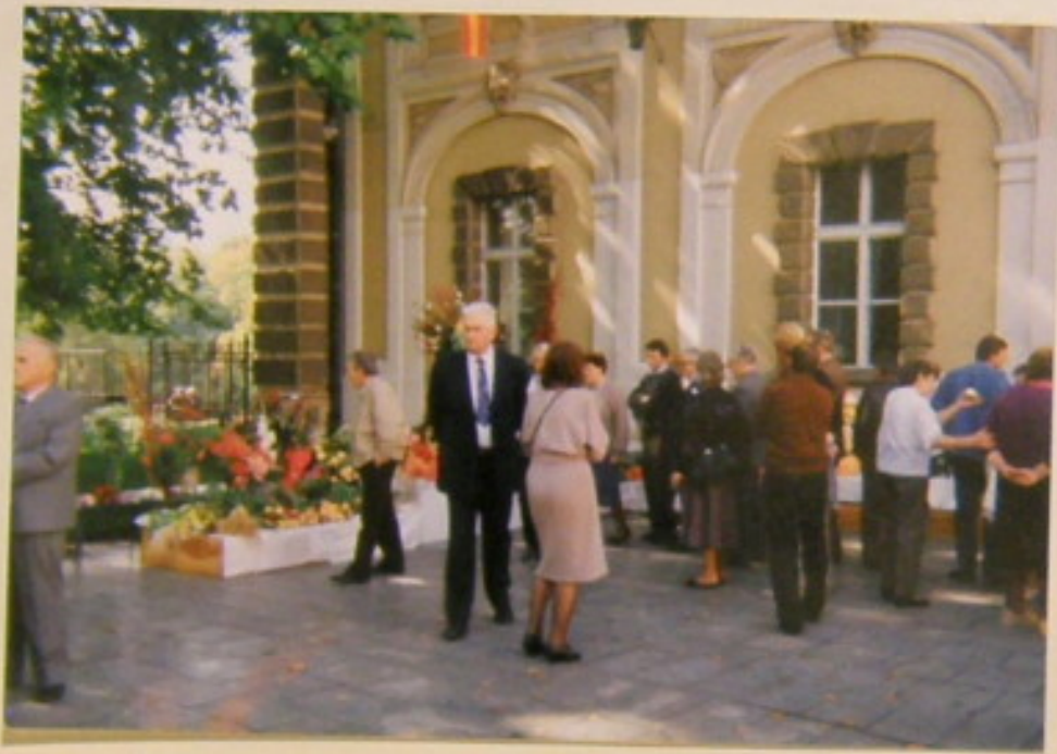
Liniejący szeregiem uwagę zwracali na "mowlizki" - warzy- wa i owoce mało jeszcze znane.