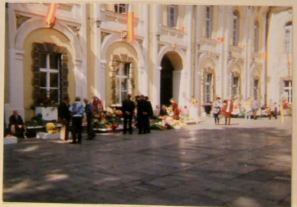
Widok ogólny na stoiska wystawowe.