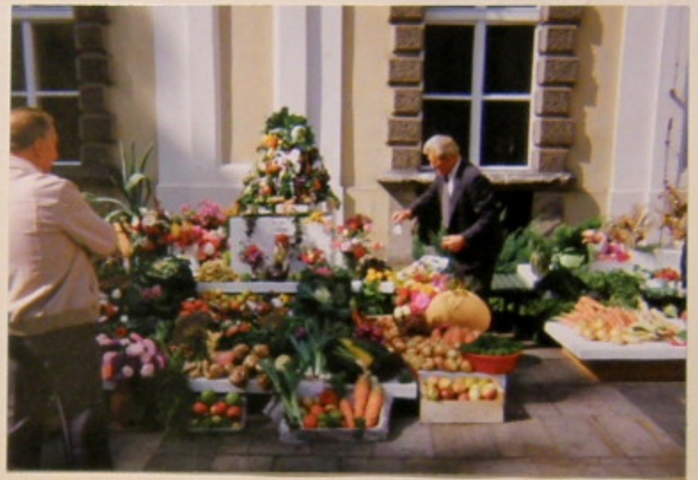
Bardzo bogate stoisko ogrodnika w Świebodzinie.