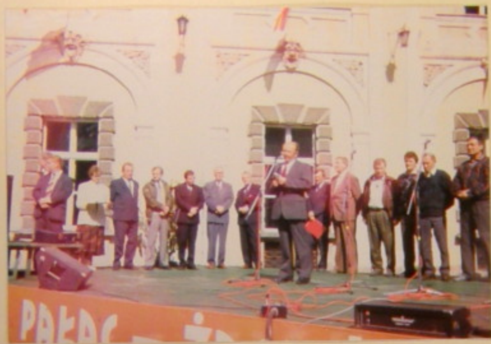
Władze wojewódzkie Łączy POD dziękują gospodarzom regionu za pracę ogrodów.