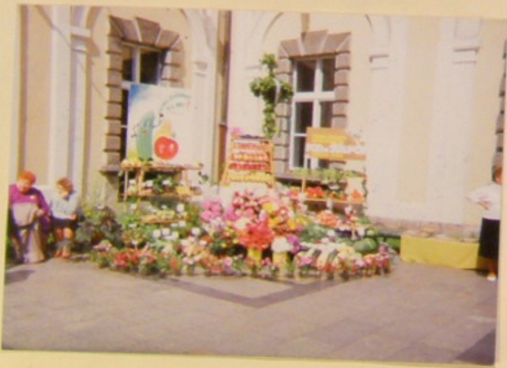
Tak prezentował swoje plony ogrodnik POD "22 lipca" "Lielonej Górze".