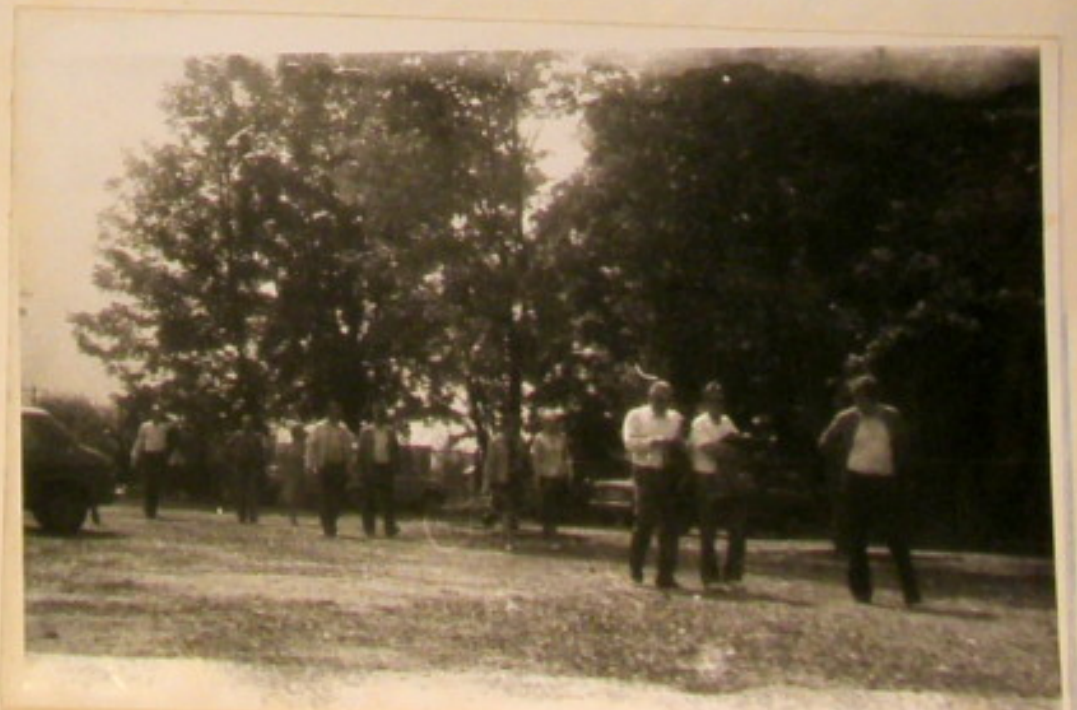
Powrót godz 20 00