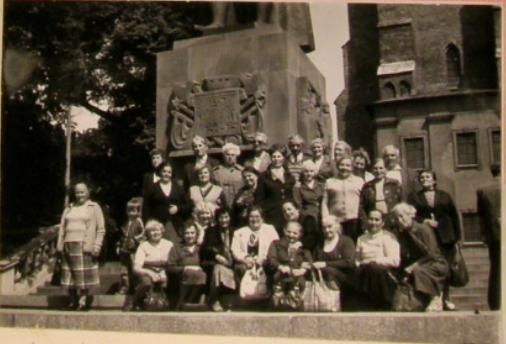
Wycieczka Seniorów do Gniezna