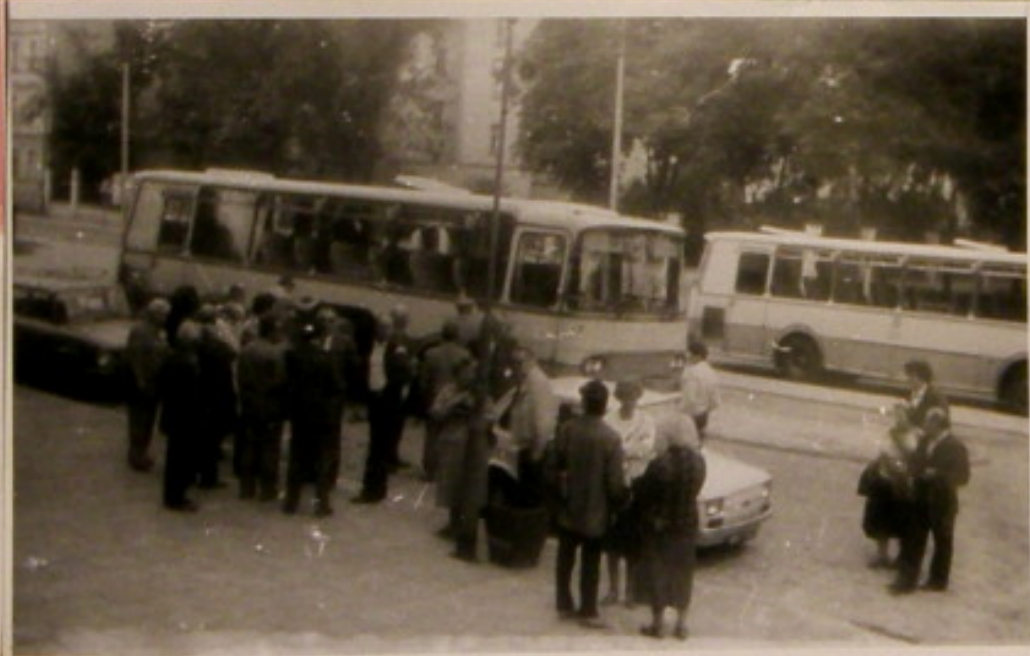
Przejazd w wycieczce.