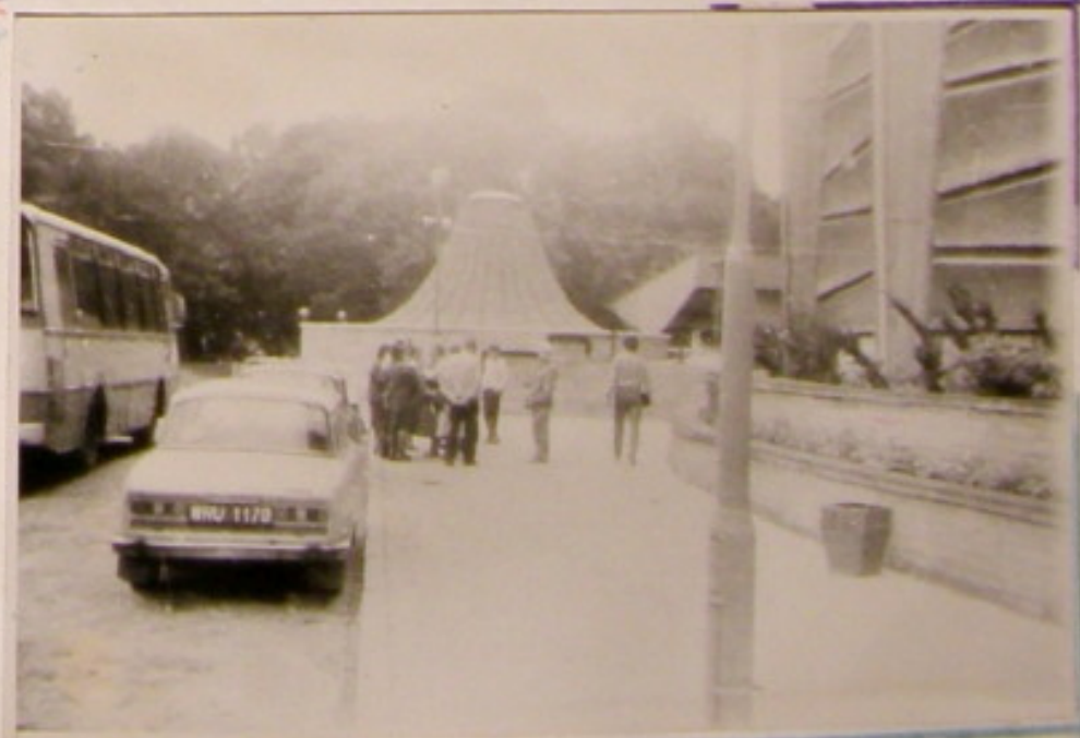
Dyskusja po wyjściu z Panoramy.