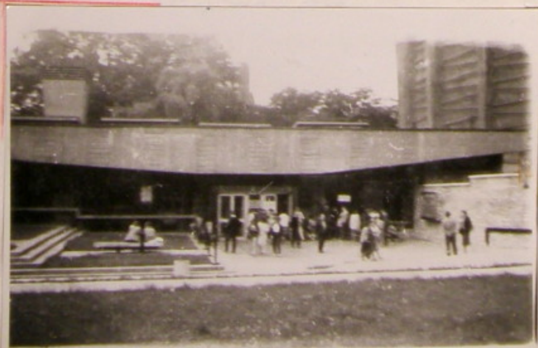
Wchodzimy do Panoramy