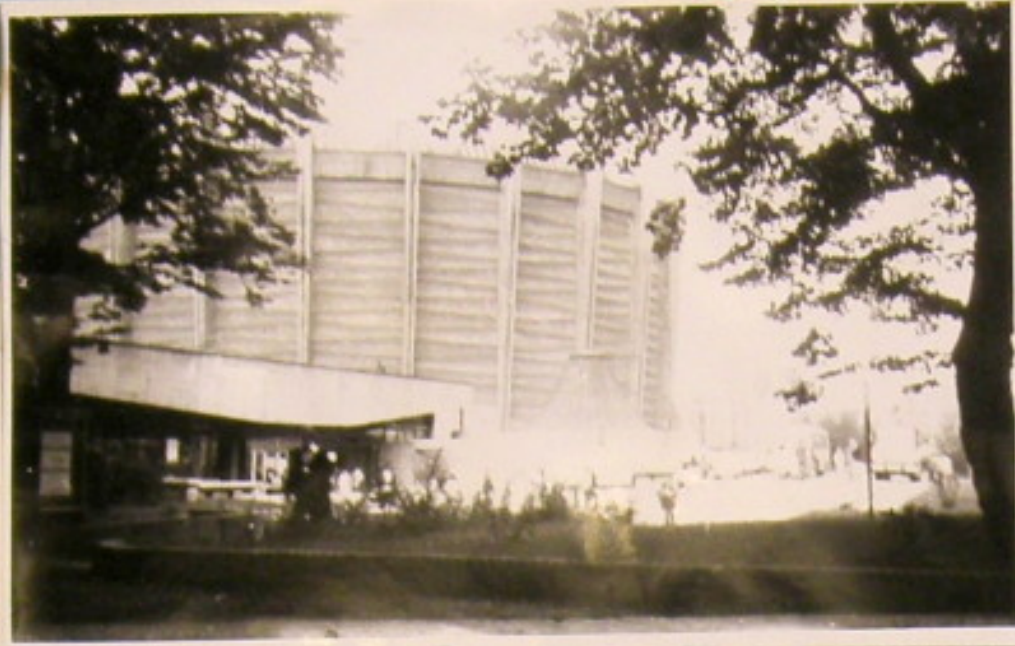
Widok ogólny Rotundy.