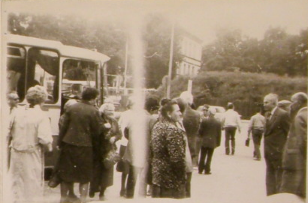
Wysiadamy! Znajdujemy się przed Panoramą