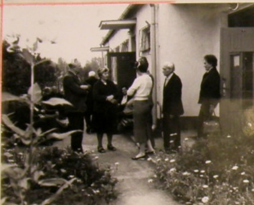
Pierwszy dzień wczasów. Seniorzy wędrują do Domu Działkowca

Jeszcze raz warto podkreślić, że wczasy na działkach zyskały sobie uznanie i cieszą się popularnością. Wiele starszych ludzi nie mogłoby wyjechać na wypoczynek do odległych miejscowości górskich czy nadmorskich nie tylko z braku funduszy, ale i braku sił do takich wояжy. Nasuwa się też refleksja ogólniejsza — okazuje się, że seniorzy pragną razem spędzać czas, że czują się dobrze w gromadzie, nad którą dobrą opiekę sprawuje PKPS. (z.r.)