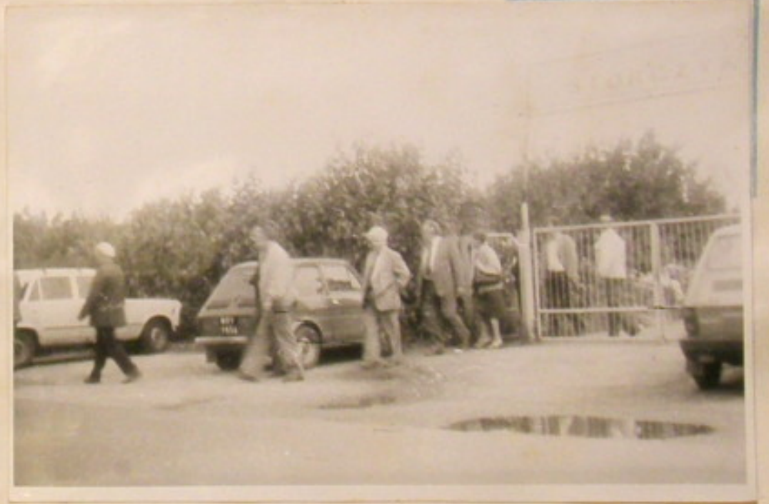
Wizytacja Ośrodków Działkowych Wrocławia.