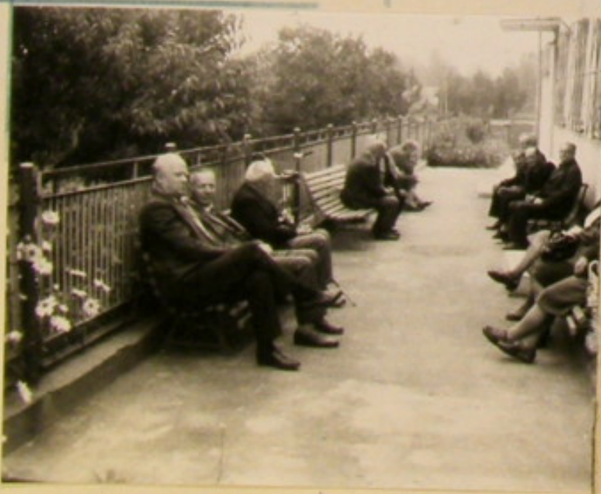
...no i wiadomo że trzeba odpowiać.