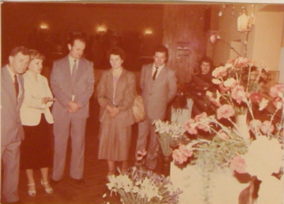
Władze partyjno-polityczne i administracyjne Krosna D. w czasie zwiedzania wystawy kwiatów zorganizowanej przez Wojewódzką Spółdzielnię Ogrodniczo-Pszczelarską, Hydriat Handlu.