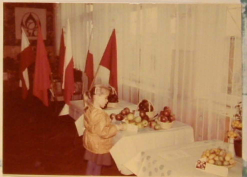
Ogólny widok wystawy plonów.