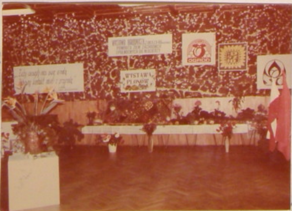
Ogólny widok wystawy plonów.