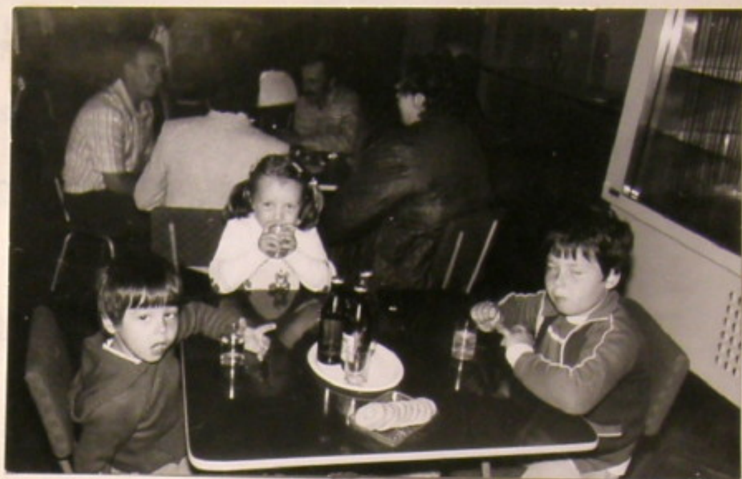
Był czas na śpiew i odpoczynek.