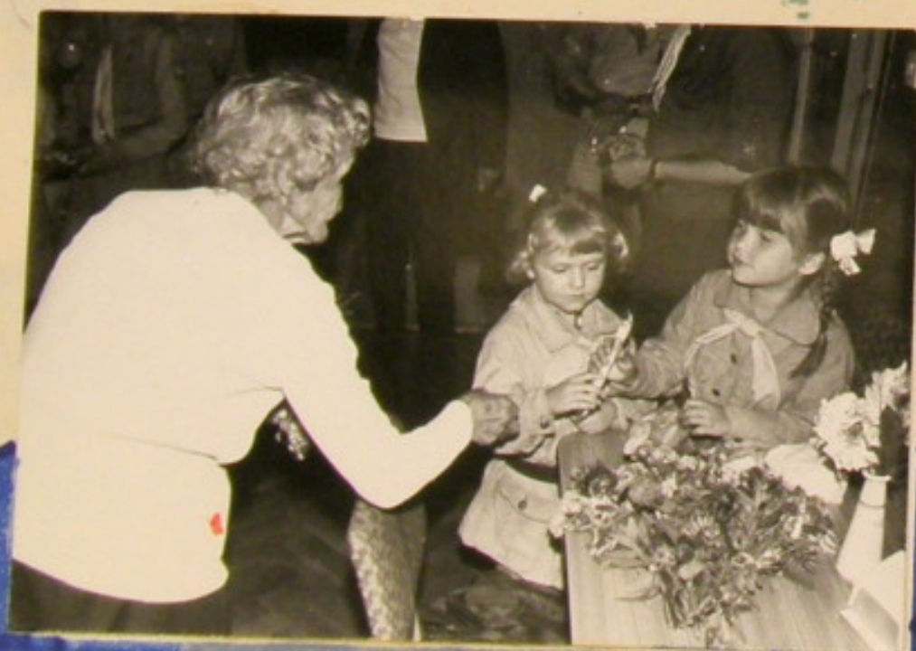
... no i lizaki dla wszystkich harcomy