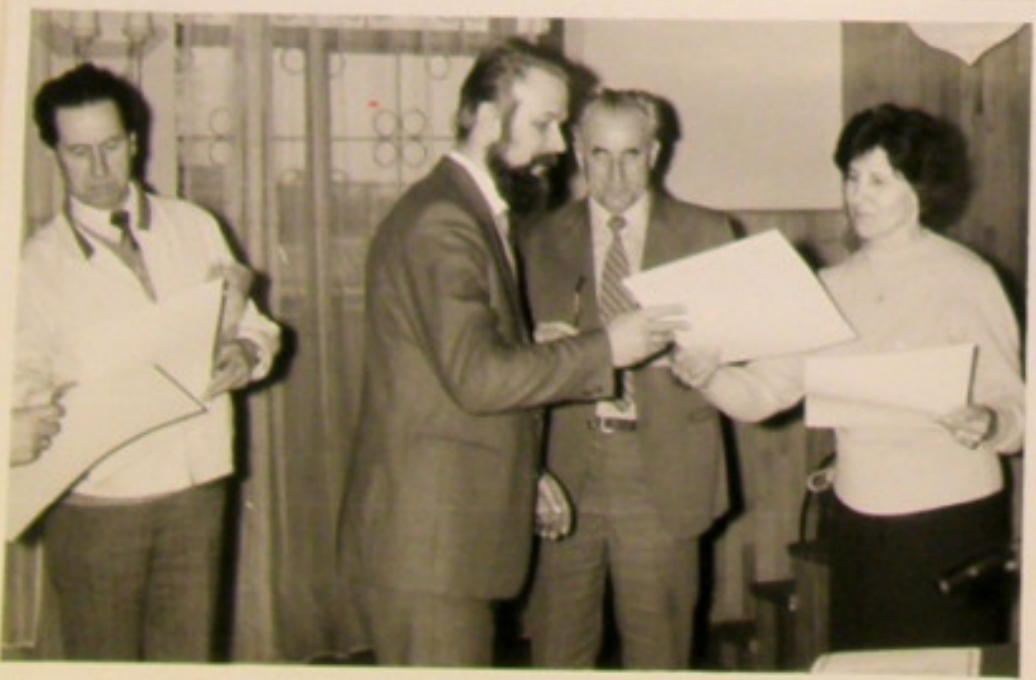
Przewodnicząca Komisji Kobiecej węgła rozwoju