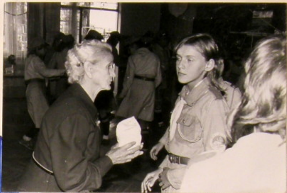
Po występach przedstawicielka seniorów wręcza harcomom skromne upominki