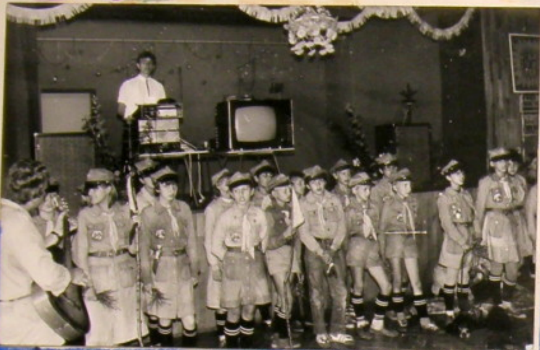
Harceme ze Śląska umilają czas seniorom Krośnienskim