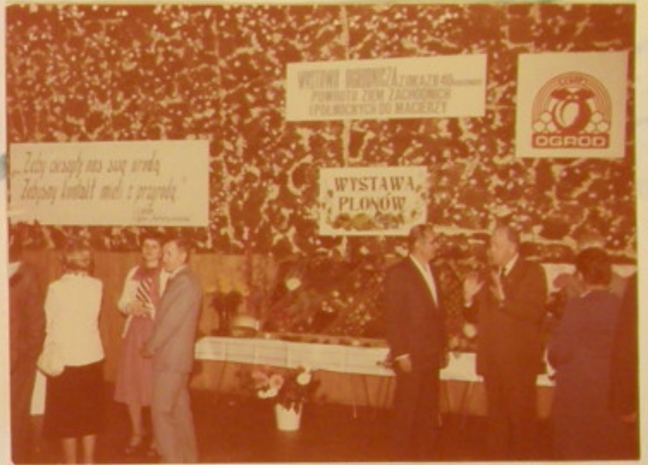
Przewodniczący M. G. Rady Narodowej Krosna D. Ob. Podkarpacki podczas zwiedzania plonów.