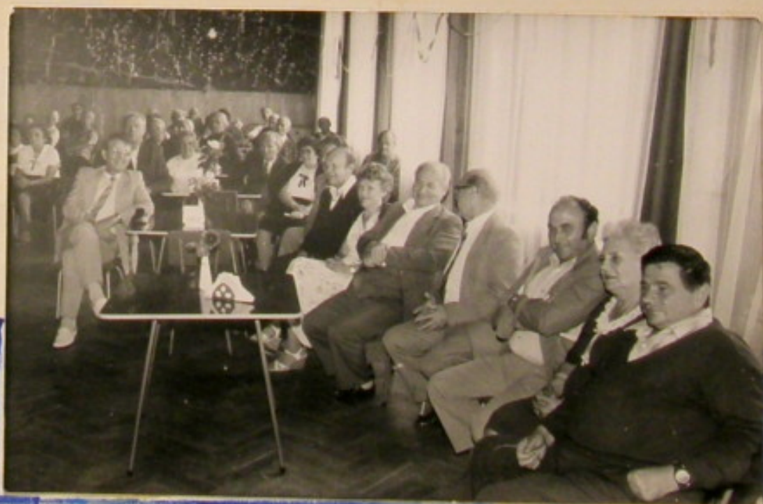
Wczasy seniora odwiedzita również delegacja z NRD