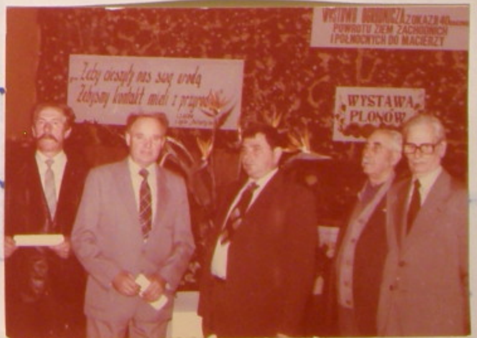
Zastuzeni i wyróżnieni działkowcy.