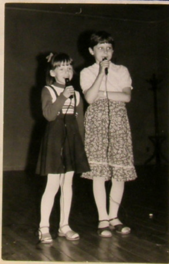
Wesoło było w ogródku i na scenie.