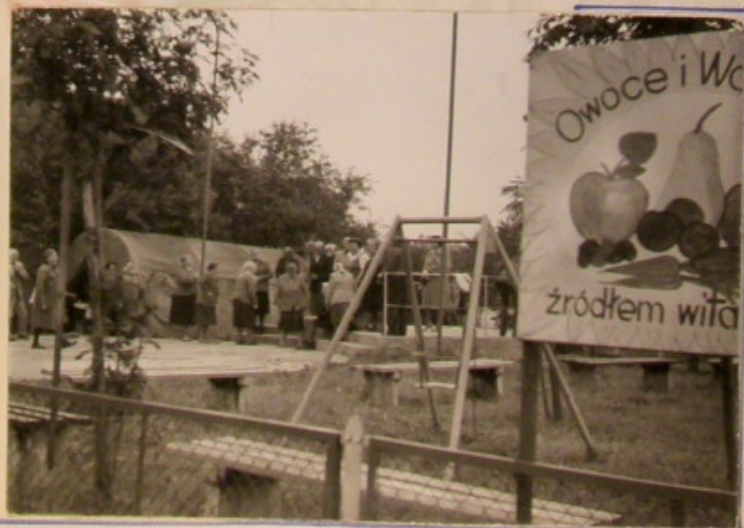
Przyjaźnelkie rozmowy między seniorami i z organizato- rami wczasów.