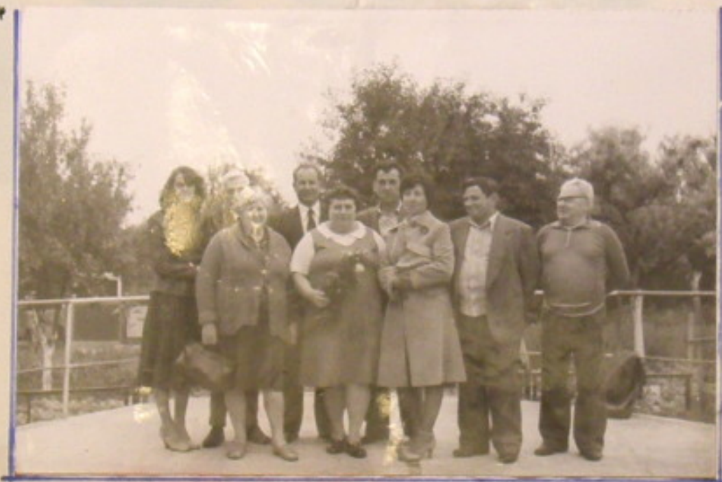
Zarząd P.O.D. wraz z Komitetem Organizacyjnym.