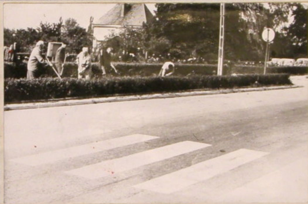
Czyn społeczny seniorów – porządkowanie i pielnie rabatów kwiatowych przy ul. Obr. Stalinskiej.