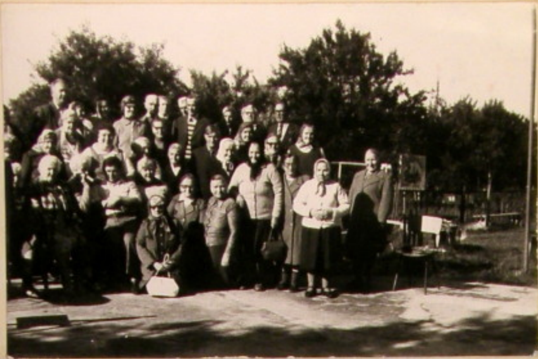
Po roku znów się spotykamy w miłym gronie.