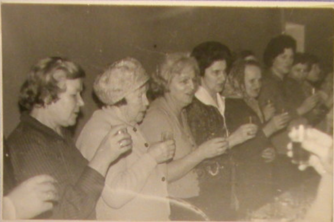
"Wiwat kobiety z naszej planety"