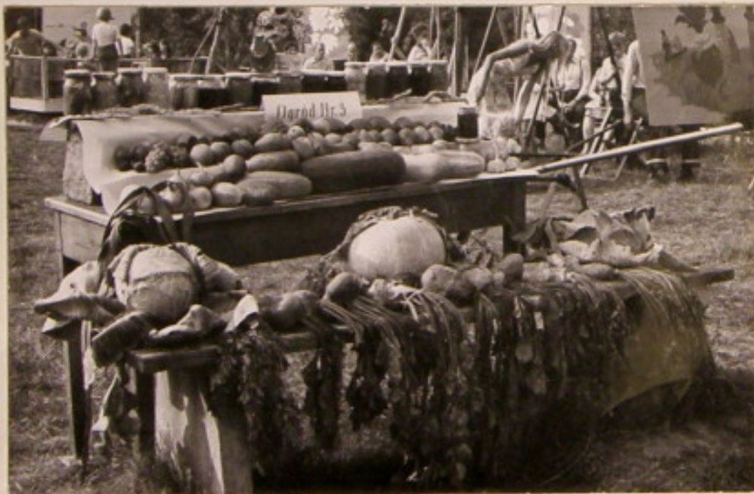
ogród nr. 3