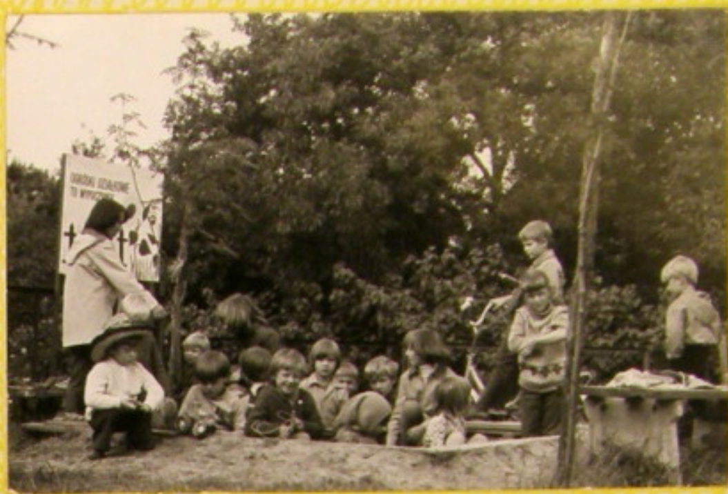
Wspólne zabawy dają dużo radości.