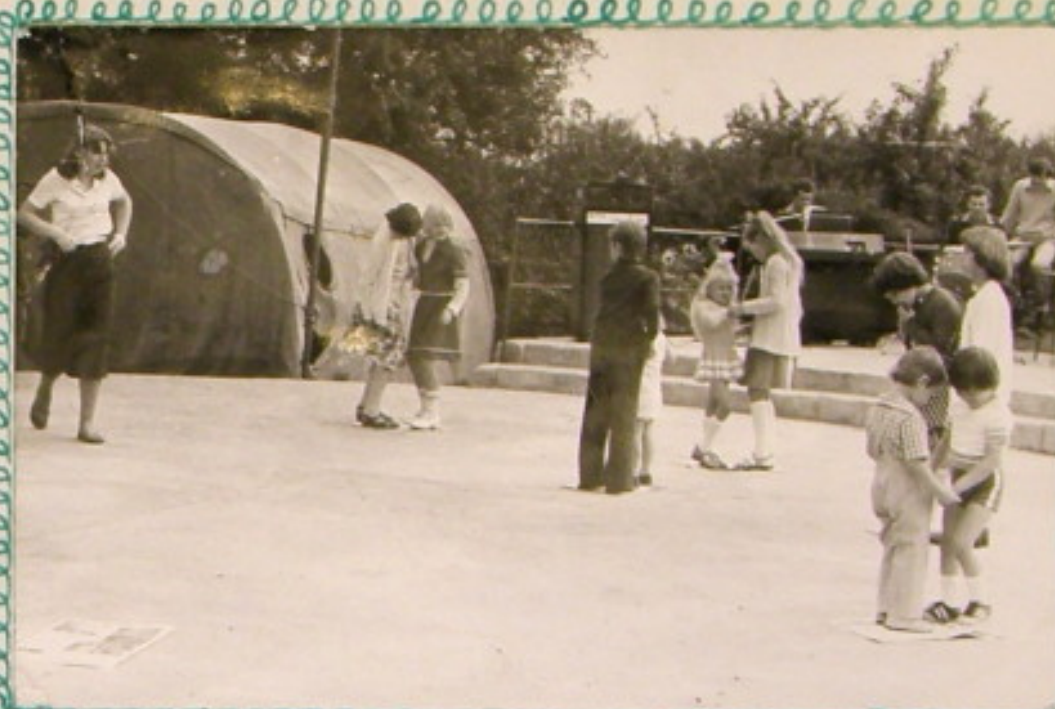
Jak przyjemnie tańczyć parami, kiedy gra orkiestra Hojskowa.