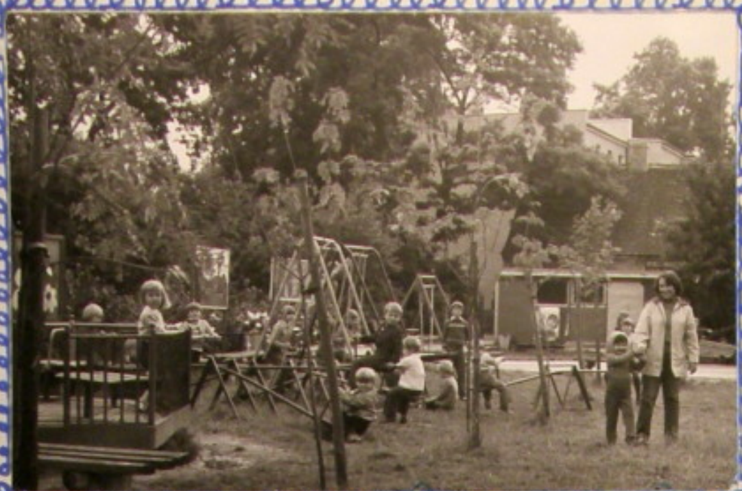
Tanie urządzenie - to dopiero raj.