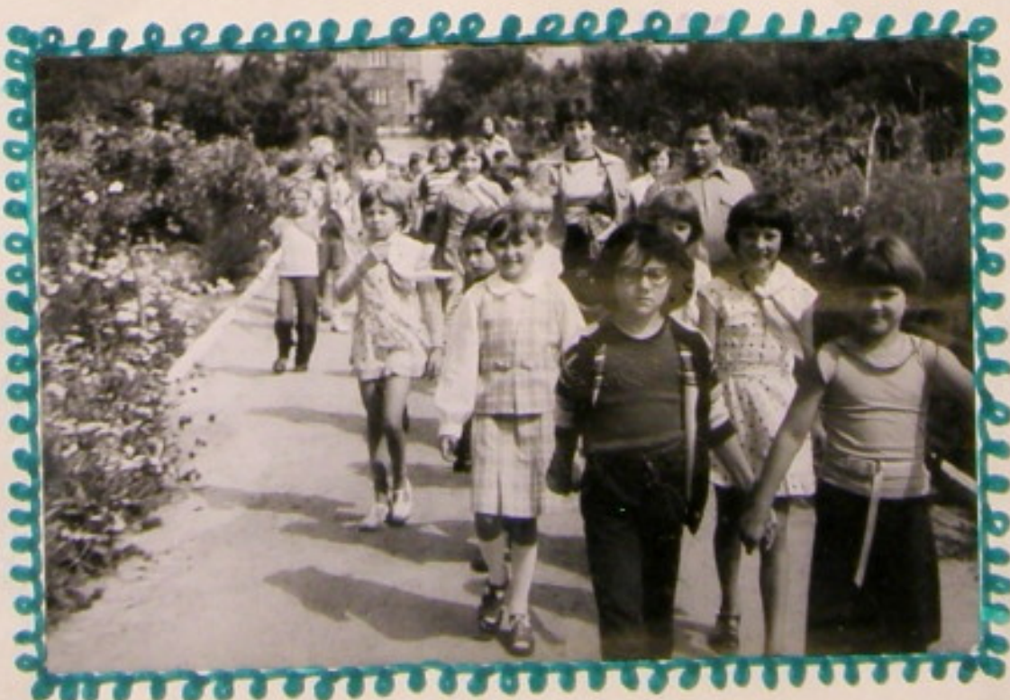
Podziwiamy piękno ogrodów działkowych pracą ludzkich rąk.