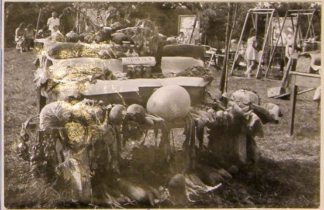
ogród nr. 4