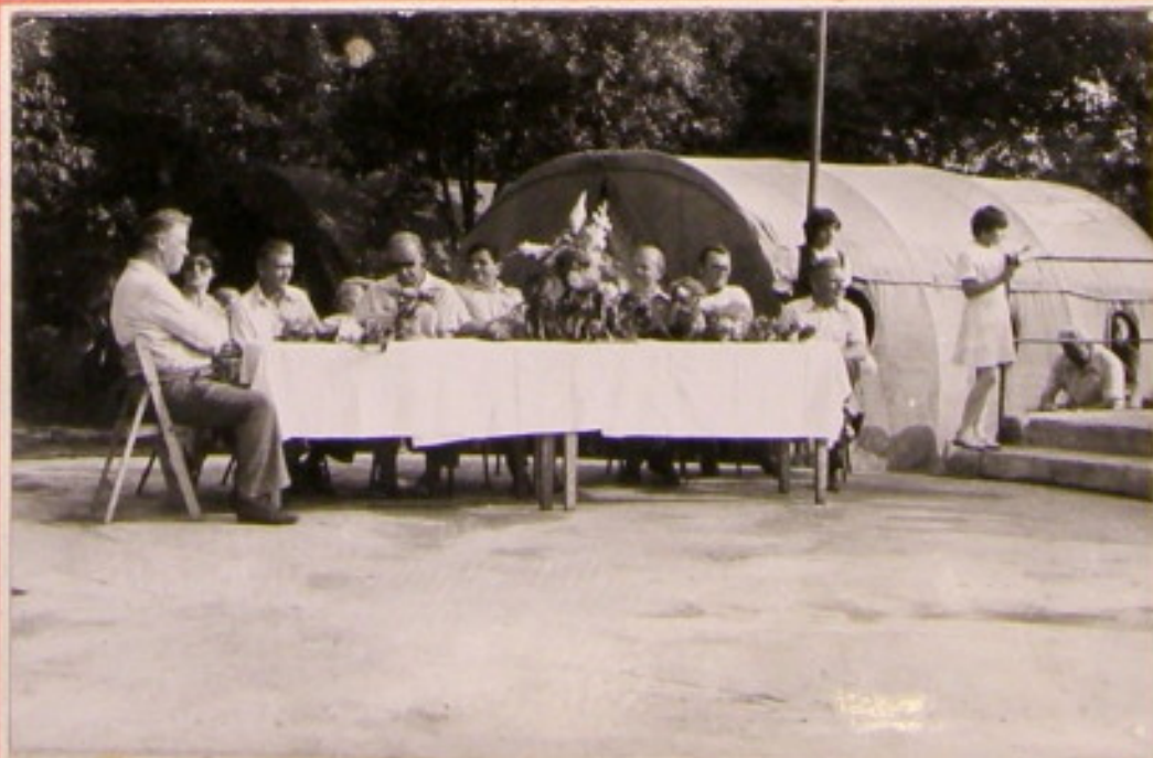
Stół presydialny z wieńcem dożynkowym.