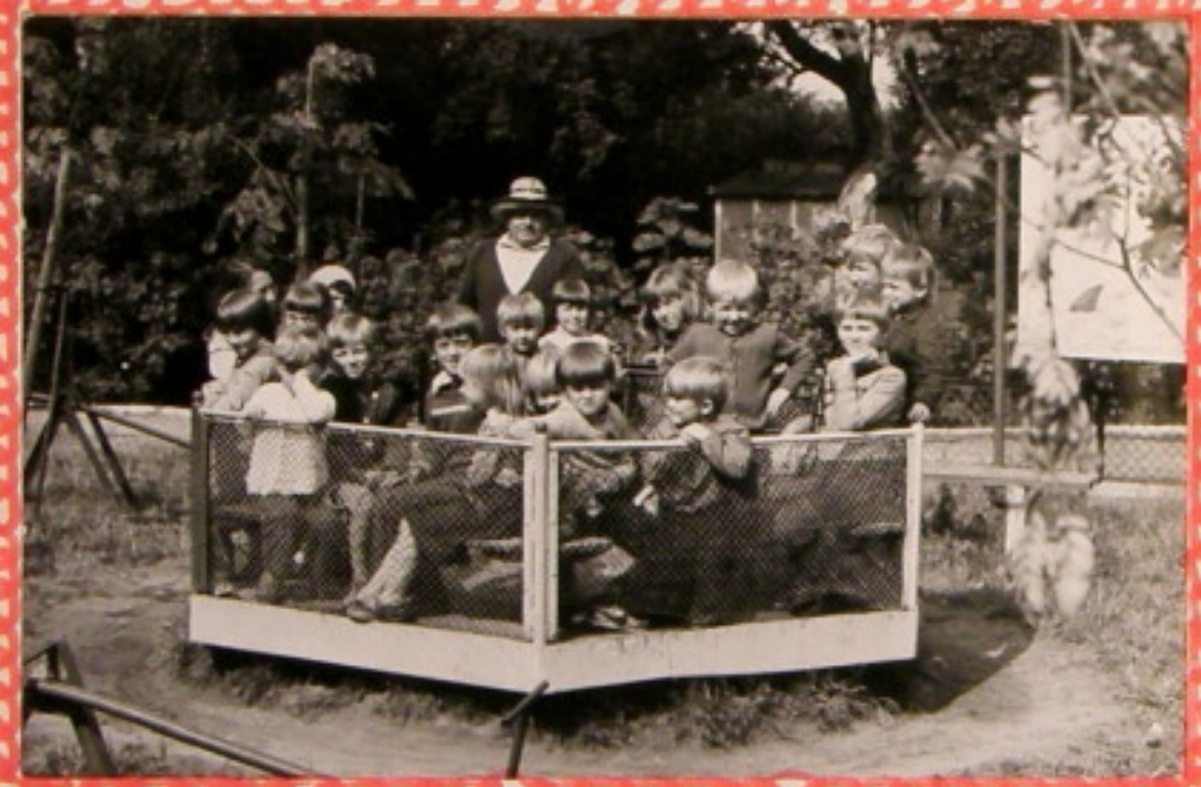
Chcę się karuzelo kręcić.