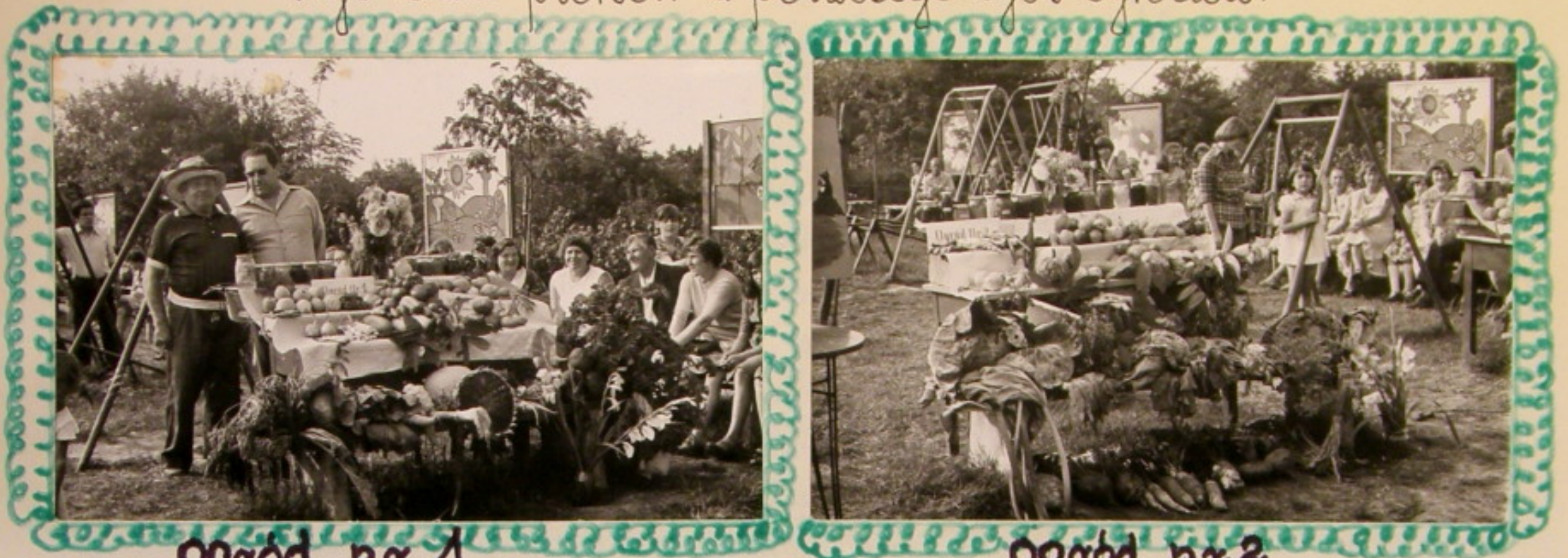
ogród nr. 1

Wystawa plonów z poszczególnych ogrodów.