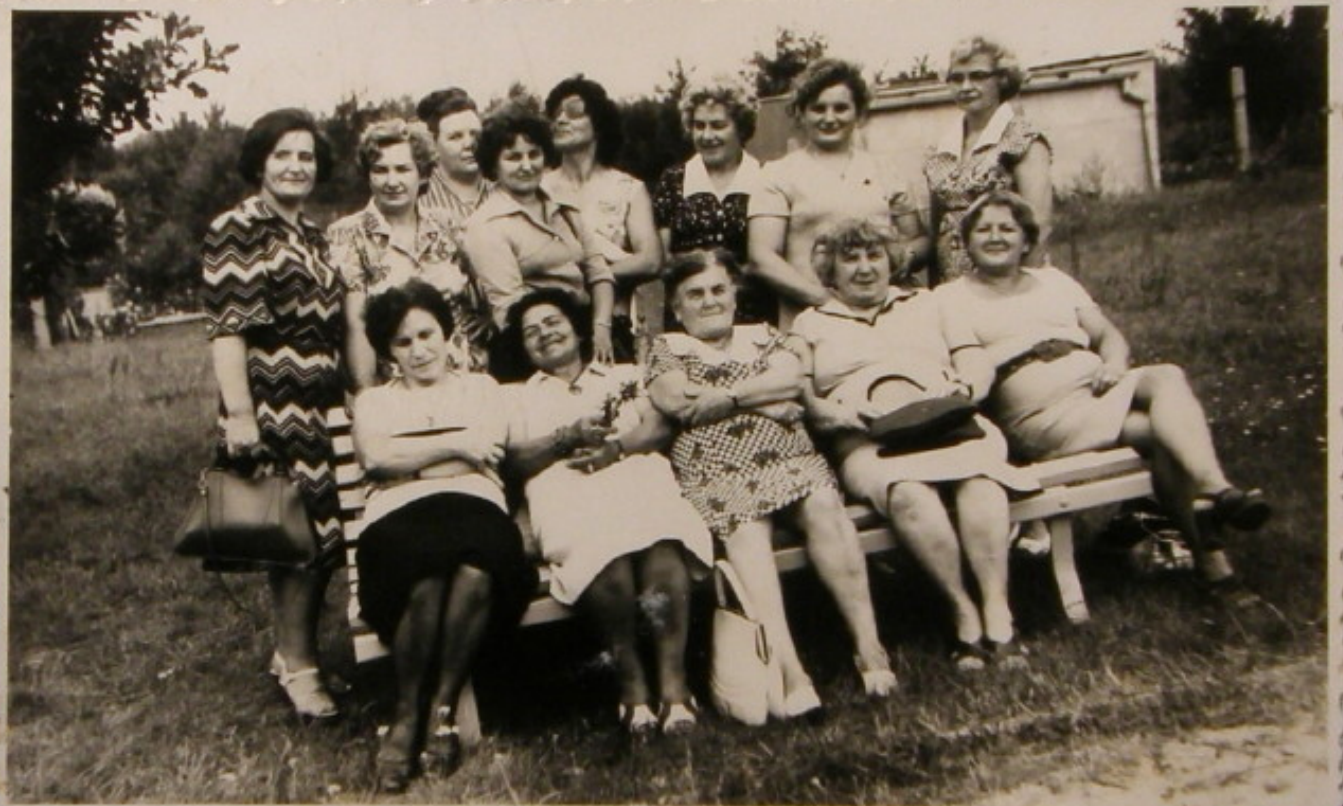
Zielonogórzanki i Krośnianki - najmiłsze dziewczyny.