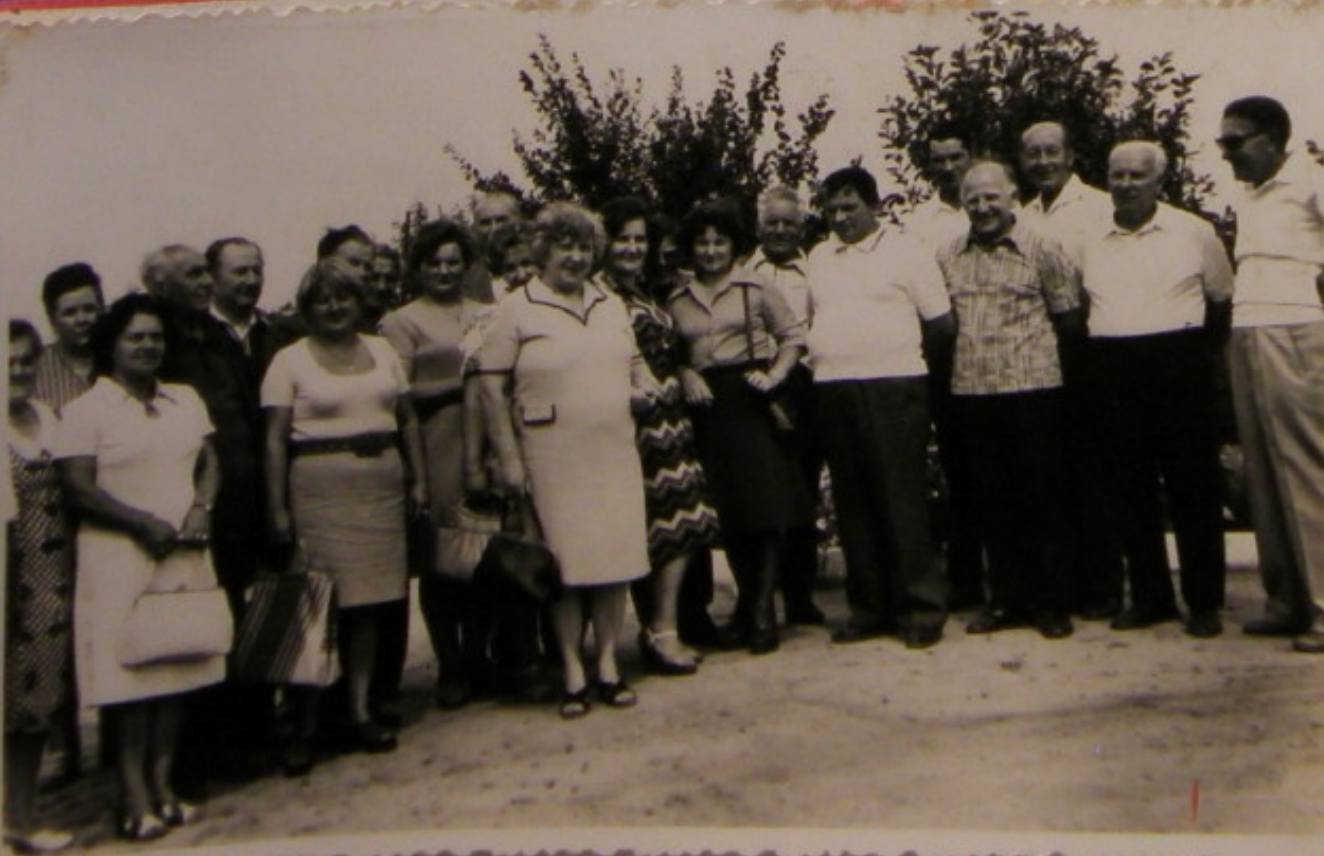
Jak miło wśród przyja- ciół - działko- niców.