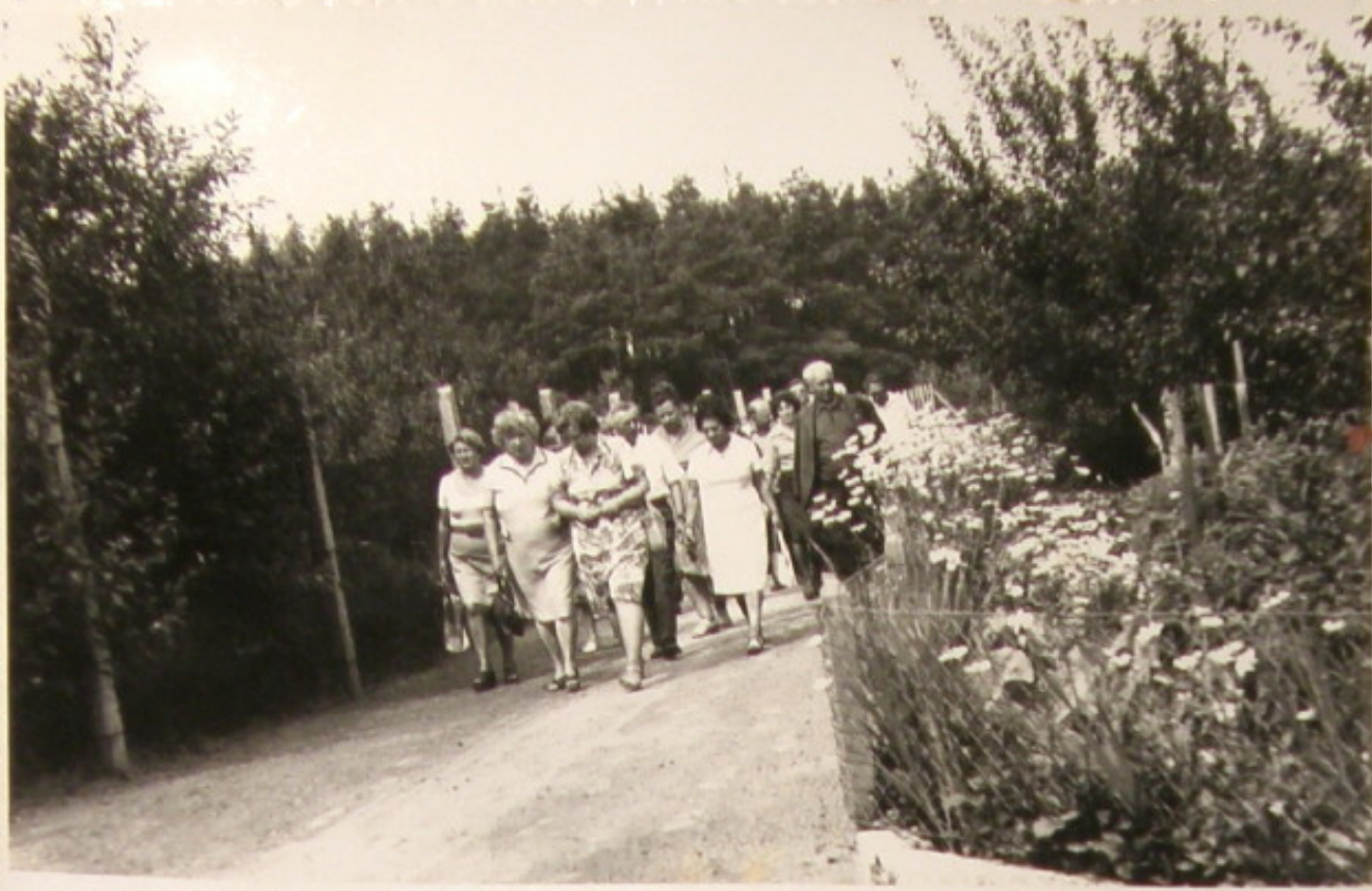
Wspólnie z Gospodarzami zwiedzamy ogród "Kolejarz" w Zielonej Górze.