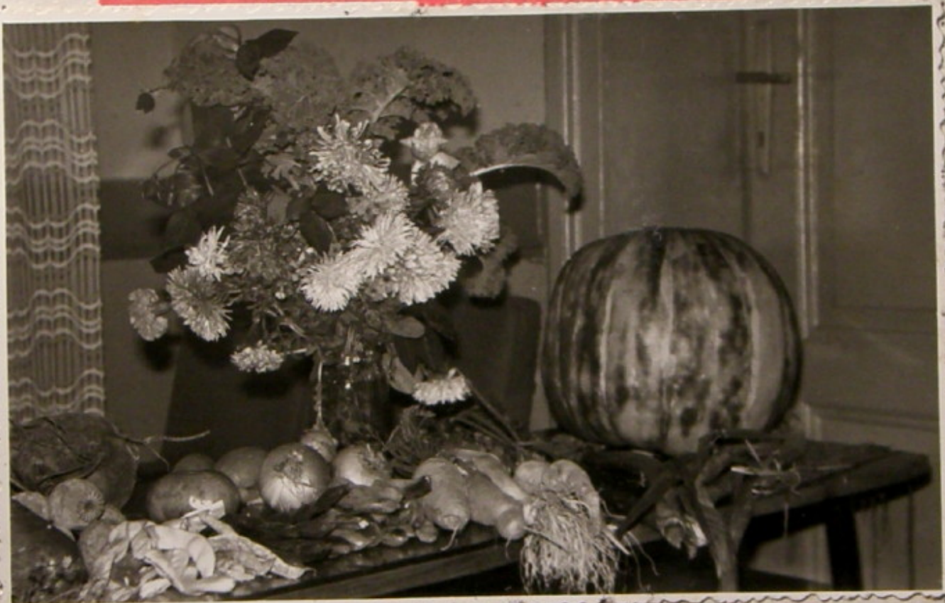
Takie piękne dynie i kwiaty mają tylko działkowcy.