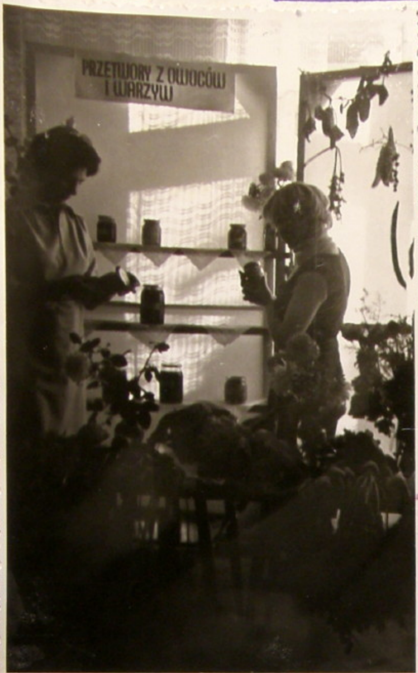
Przetwory z warzyw i owoców to specjalność naszych pań.