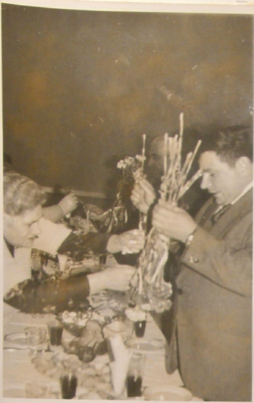
Gospod. ogr. przy ul. Obr. Stalingradu St. Obecny wręcza kwiaty.