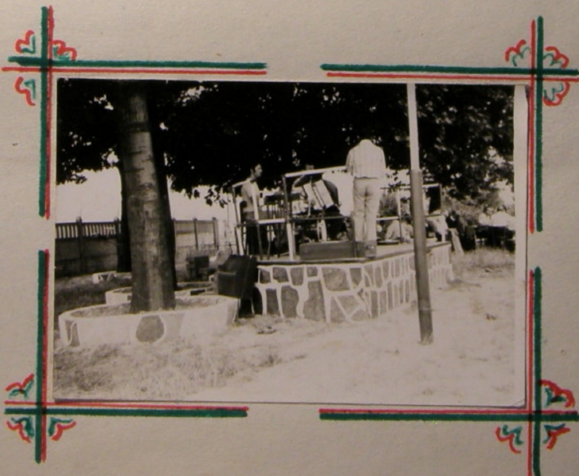
Podium skończone - gra orkiestra z HOP-u.

A co już zostało zrobione pokaże załączone zdjęcie.