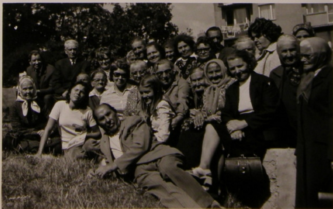
Wypoczynek przy amfiteatrze w Zielonej Górze.