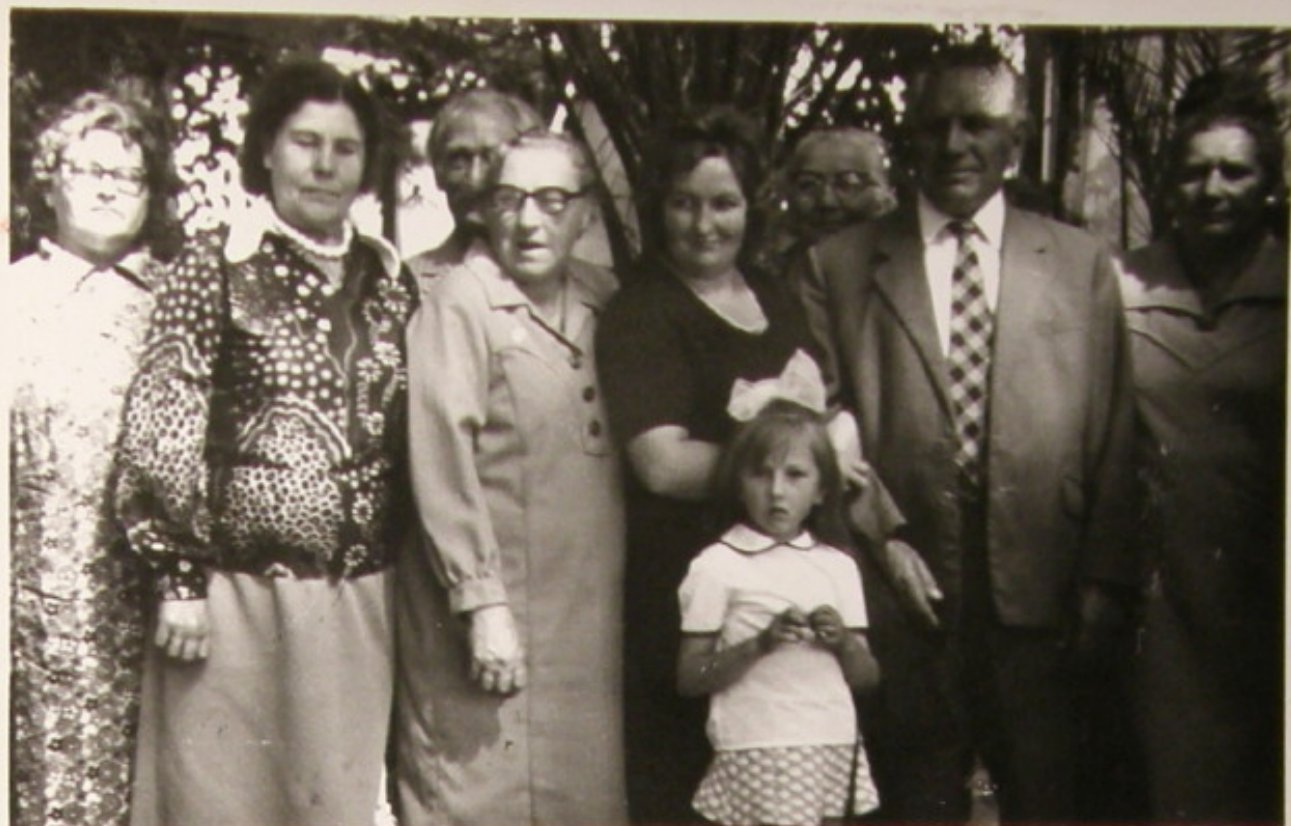
Pamiątka z pobytu u Palmiarni.