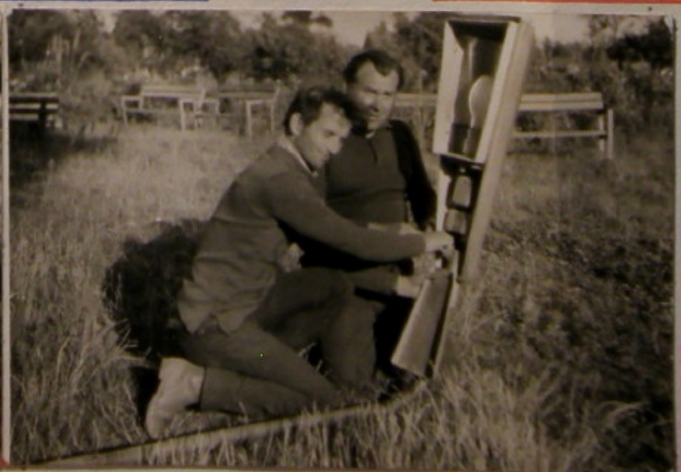
Działkowieze podłączają światło u „Ogródka Jordanowskim.”