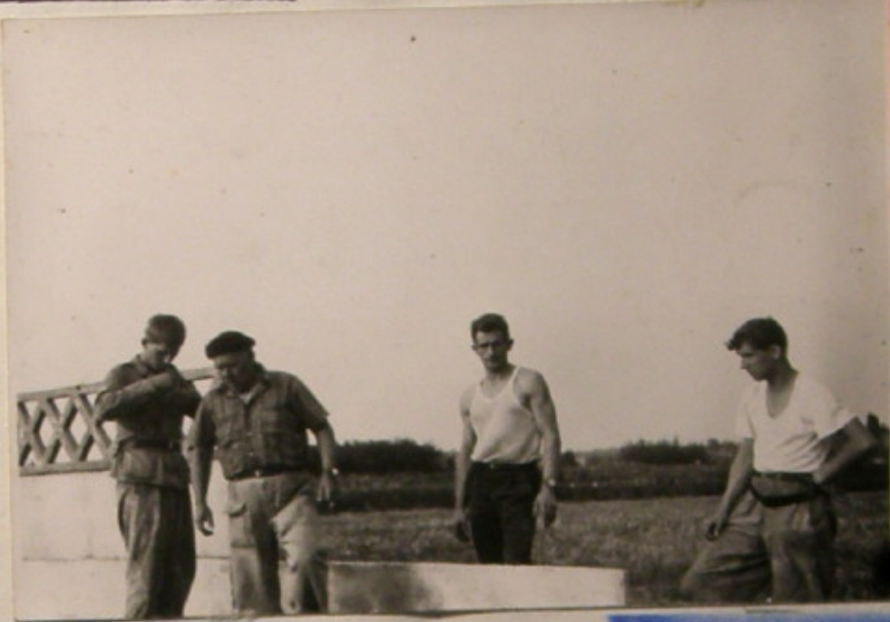
Grupa działkowców pracuje przy czynie społecznym.