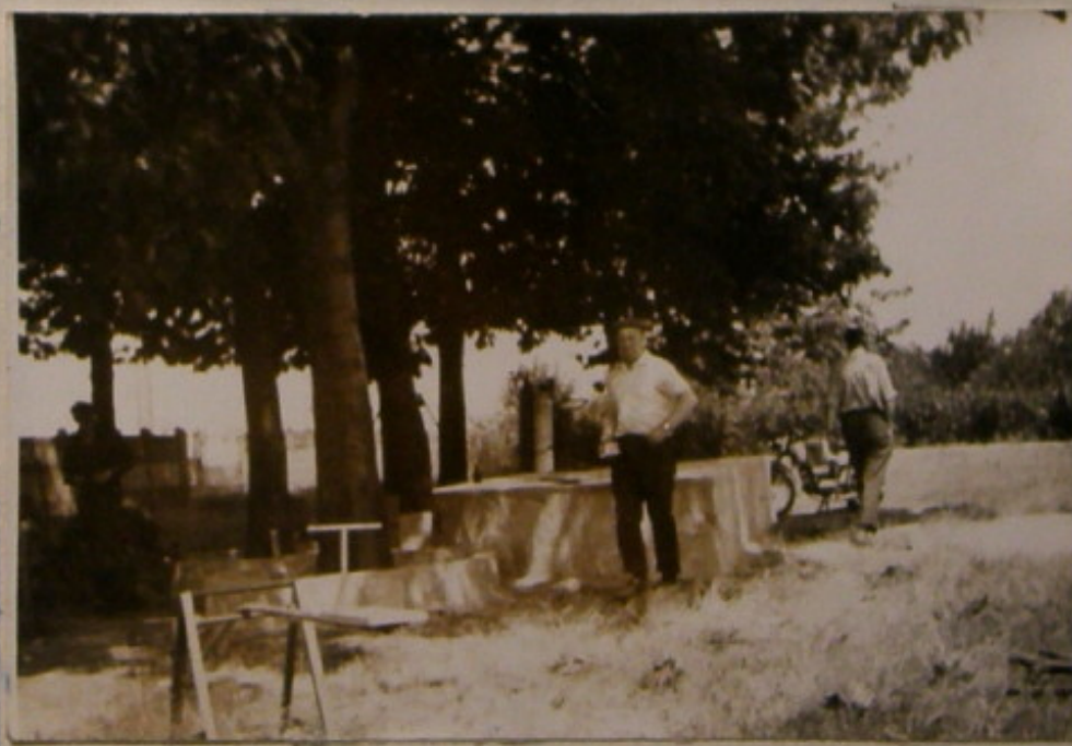
Gospodarz ogrodu nr. 2 Henryk Harunek sprawdza jak zostało wykonane podium.